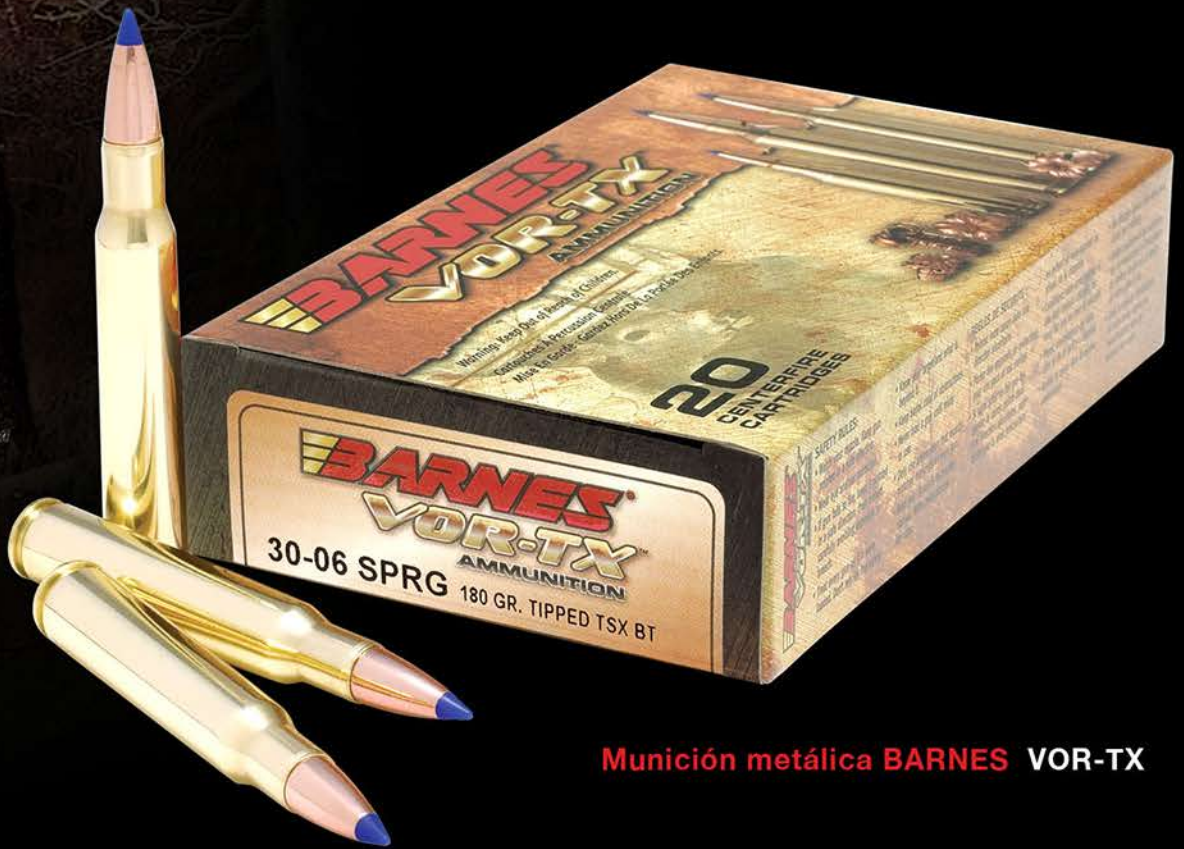
Munición metálica BARNES VOR-TX