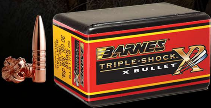
PUNTAS BARNES TSX