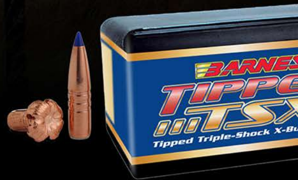
PUNTAS BARNES TTSX