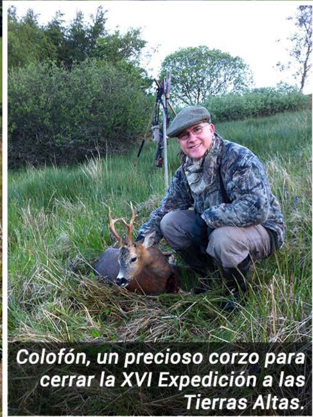
Colofón, un precioso corzo para cerrar la XVI Expedición a las Tierras Altas.