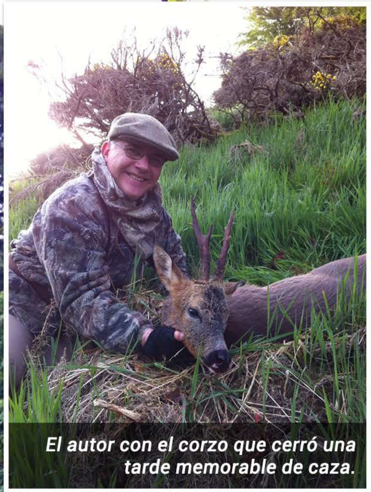
El autor con el corzo que cerró una tarde memorable de caza.