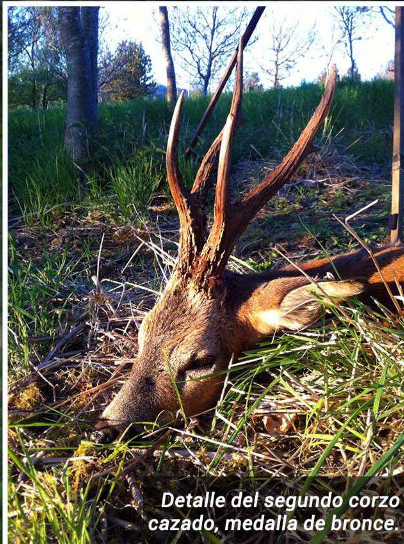
Detalle del segundo corzo cazado, medalla de bronce.

La concesión de Steve en las Highlands es un auténtico paraíso corcero, ese hábitat en mosaico tantas veces comentado y tan querencioso para el pequeño cérvido: prados, bosquetes y agua. Corzos en abundancia y no exentos de calidad. En la primera salida la mañana del pasado 10 de junio, vimos mucha caza, pero desestimé tirar al no ver ningún ejemplar de calidad y/o selectivo, sin embargo, por la tarde... ¡cacé tres corzos! Dos medallas de bronce y un tercero bueno, en una de las mejores tardes, si no la mejor, de mi vida de cazador.