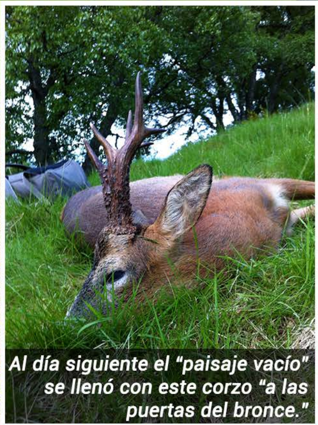
Al día siguiente el "paisaje vacío" se llenó con este corzo "a las puertas del bronce."