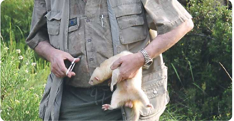
Método de caza ilegal en Galicia.

matosis). Una vez superada la difícil edad juvenil, la mayor parte de los conejos adultos escapará a la depredación, siempre que no se vean afectados por otros procesos infecciosos (por ejemplo enfermedad hemorrágica del conejo), y se mantengan intactas las medidas del medio que le confieren protección (madriguera, cobertura de matorral, etc.). En general, los machos son más depredados por las rapaces, mientras que las hembras lo son más por los carnívoros. El tipo de hábitat determinará la mejor o peor facilidad para la depredación por una clase u otra de depredadores. Así, por ejemplo, las rapaces diurnas serán más efectivas en áreas poco cubiertas de vegetación, mientras que carnívoros como el zorro tendrán más eficacia en áreas donde la cobertura vegetal sea mayor y no se prodiguen las madrigueras.