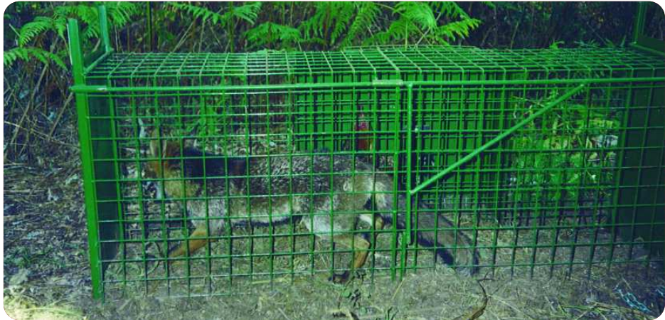
Método de control de predadores selectivo.