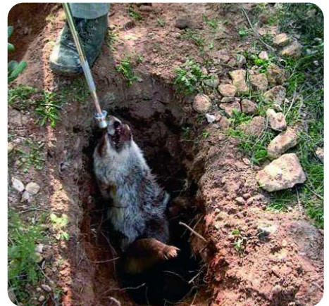
Captura de zorros con la ayuda de perros de madriguera

No es sorprendente que recientemente hayamos comprobado que el número de aves rapaces amenazadas de una localidad determinada esté estrechamente ligado a la abundancia de conejos. Es por ello que, entre las primeras medidas de conservación para la gran mayoría de los depredadores amenazados españoles, se encuentre la recuperación de las poblaciones de conejo. En un estudio reciente, demostramos que la abundancia de conejos es mayor en aquellas áreas cinegéticas en las que son valorados como especie cinegética, seguidas por