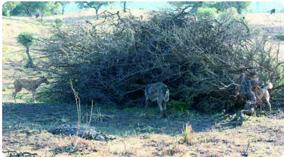
Grupo de perros asilvestrados cazando conejos en un refugio artificial