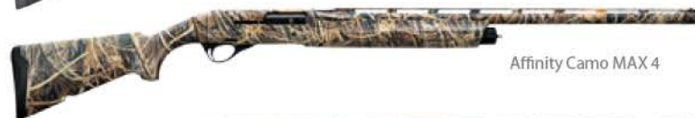
Affinity Camo MAX 4