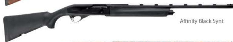
Affinity Black Synt