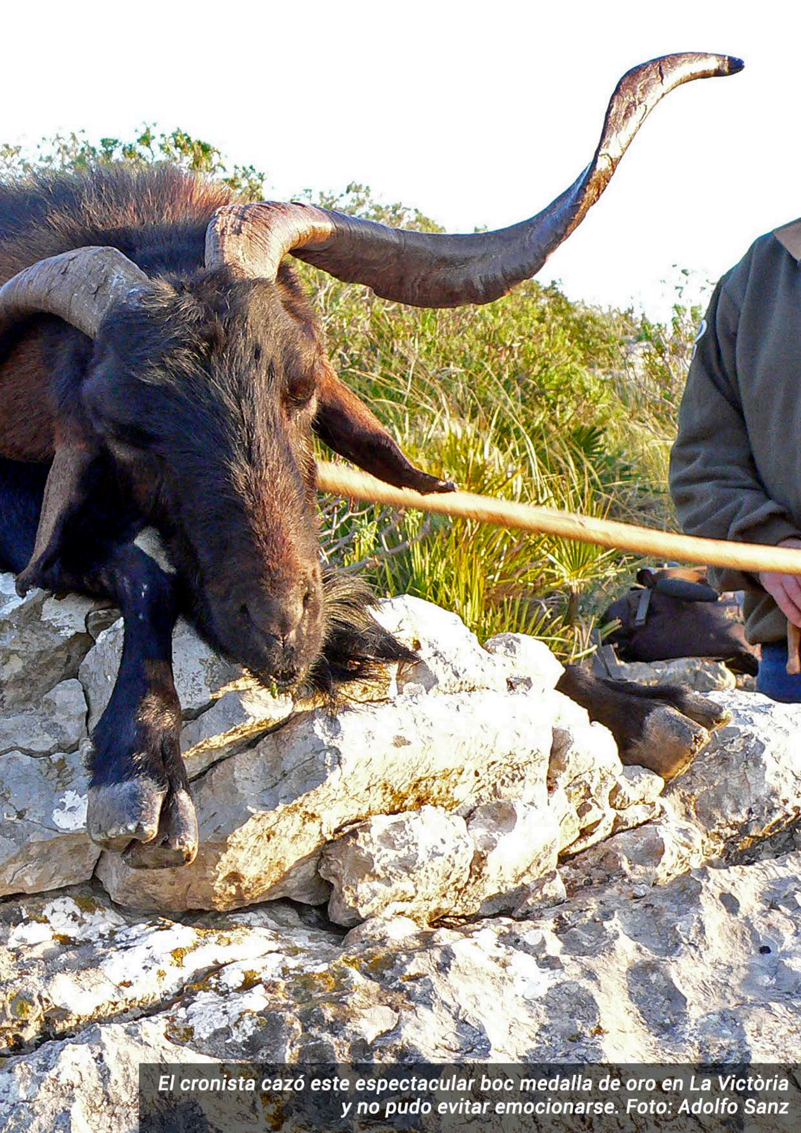
El cronista cazó este espectacular boc medalla de oro en La Victòria y no pudo evitar emocionarse.