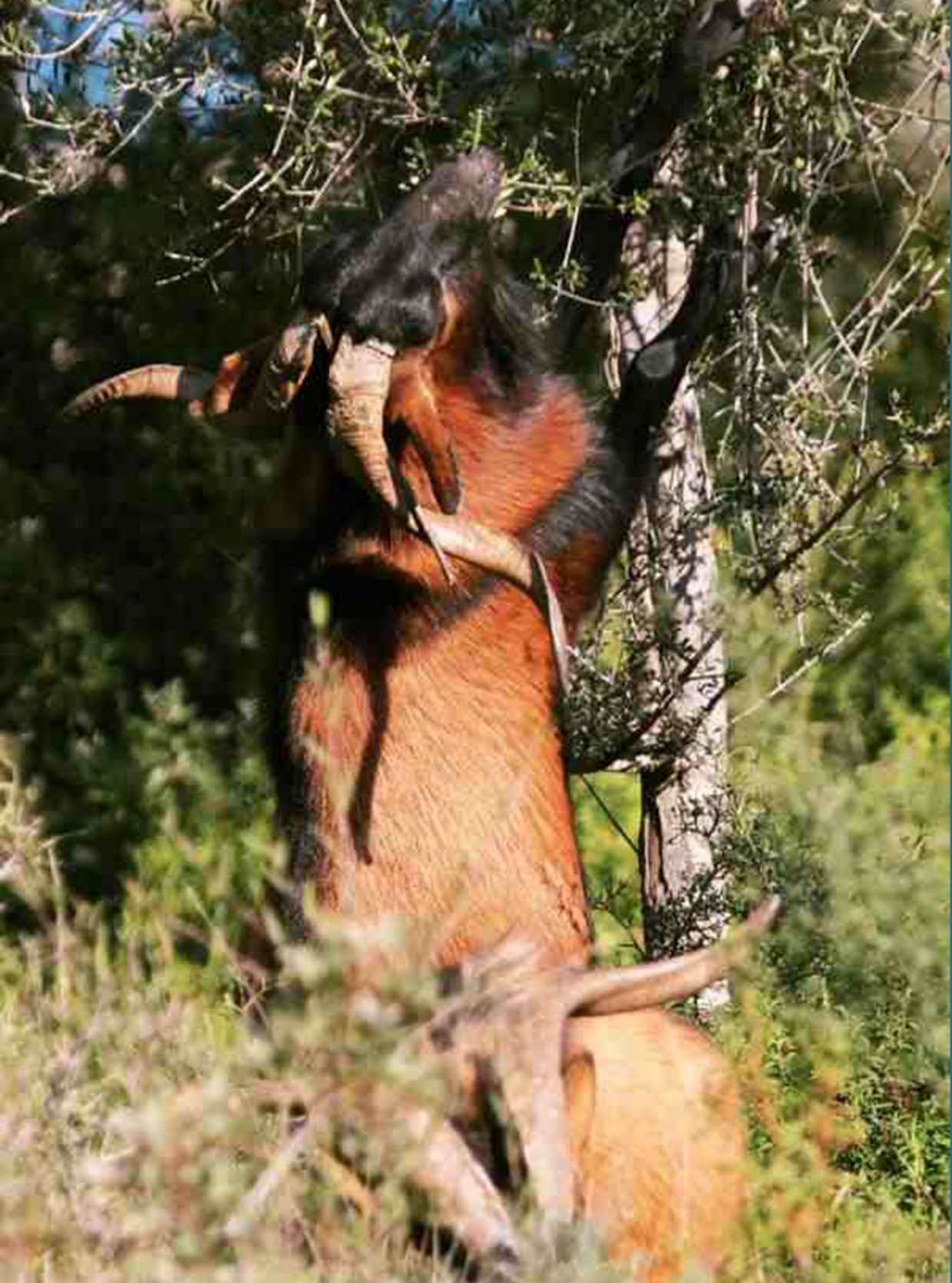
Un excelente boc ramoneando.