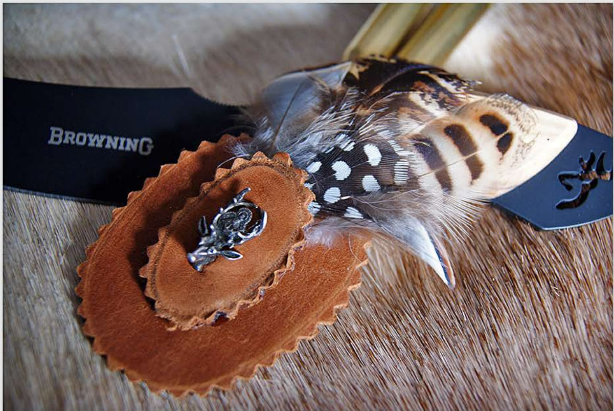
Base de cuero de ternera, con plumas de codorniz, perdiz y gallina de Guinea. Adorno del ciervo de San Huberto en plata.