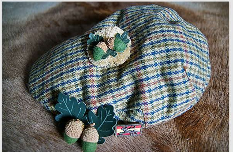
Broches para gorras y sombreros elaborados con rafia, fieltro, cuero y cascabillos naturales de bellota.