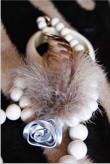
Acero y plumas de faisán hembra.