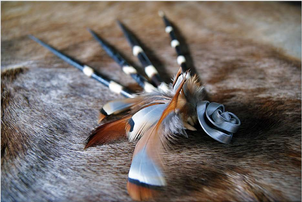
Acero y plumas de perdiz y gallina morucha.