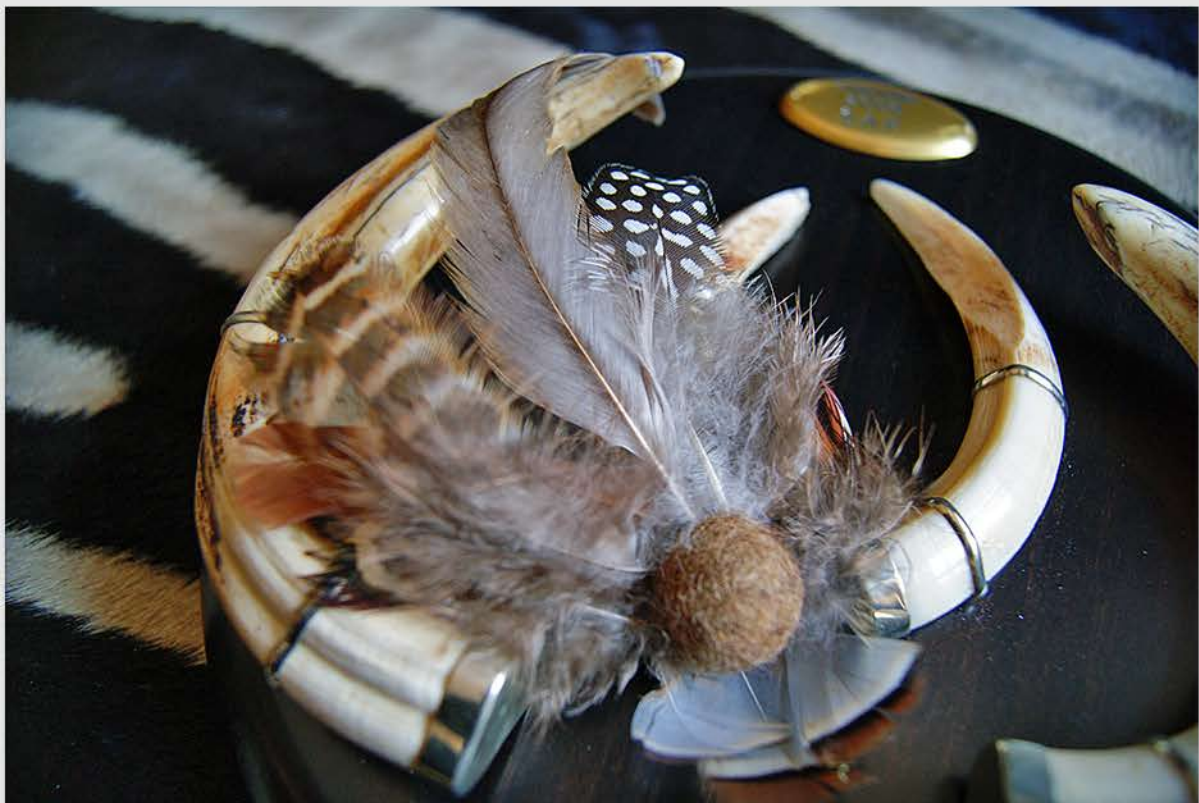
Botón de fieltro y plumas de faisán, gallina de Guinea y faisán.