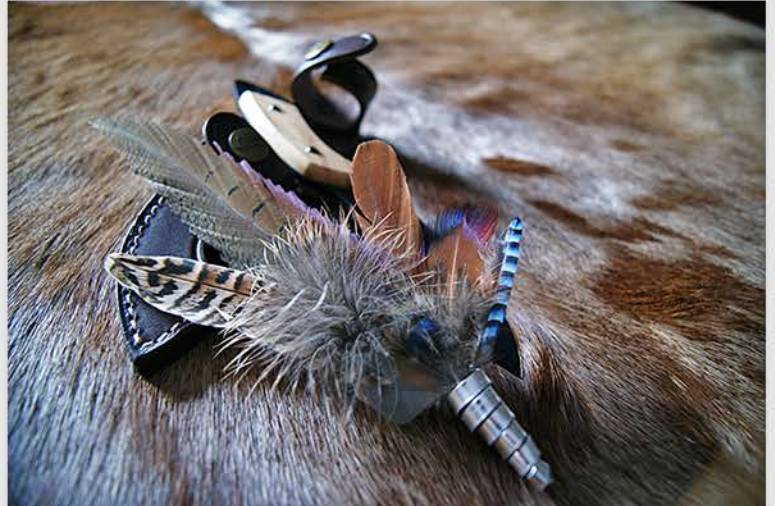
Acero y plumas de faisán y arrendajo.