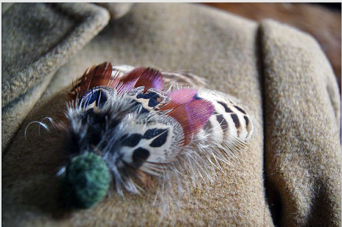
Botón de fieltro con plumas de faisán macho-hembra.