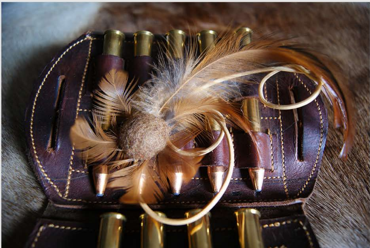
Botón de fieltro, filamentos de madera y plumas de gallinas.