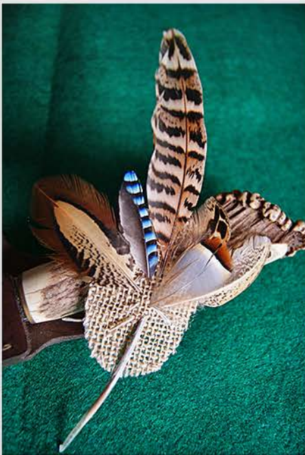
Base de rafia con plumas de faisán, arrendajo y perdiz.