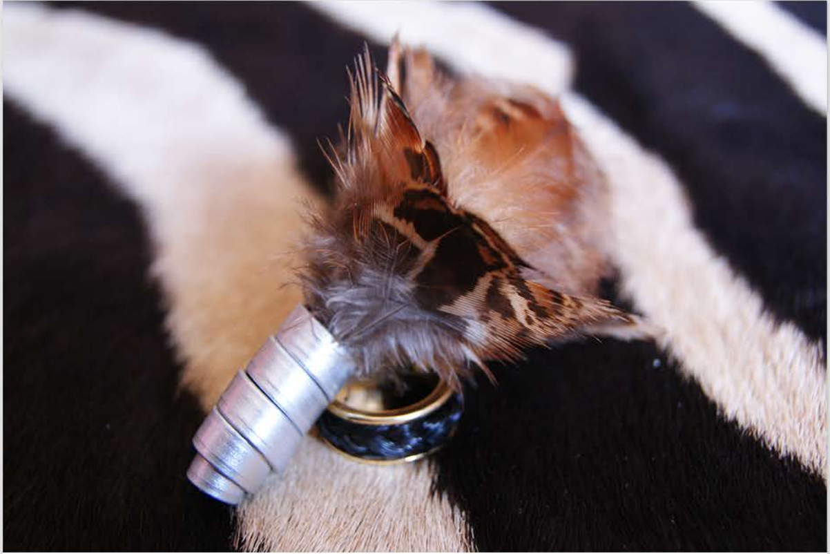
Acero con plumas de gallinas y faisán.