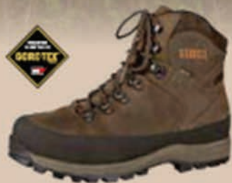
Pro Hunter GTX® 7.5"