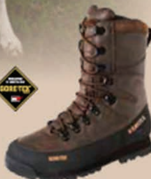
Mountain Hunt GTX® 10" Flex