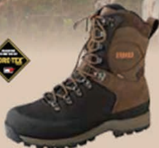
Pro Hunter GTX® 10" Reinforced