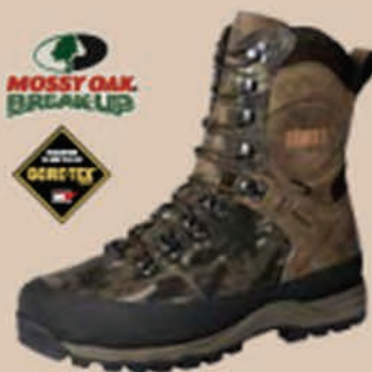
Pro Hunter GTX® 10" Mossy Oak®